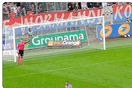
PANNEAUX FIXES ET TOBLERONE DERRIERE LE BUT