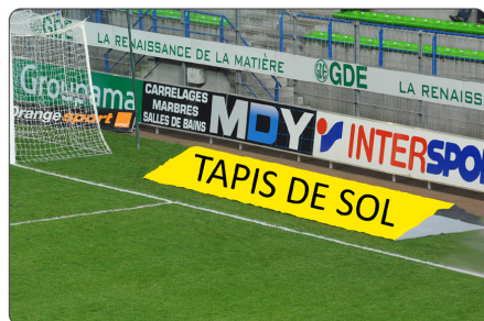
TAPIS DE SOL DERRIERE LA LIGNE DE BUT